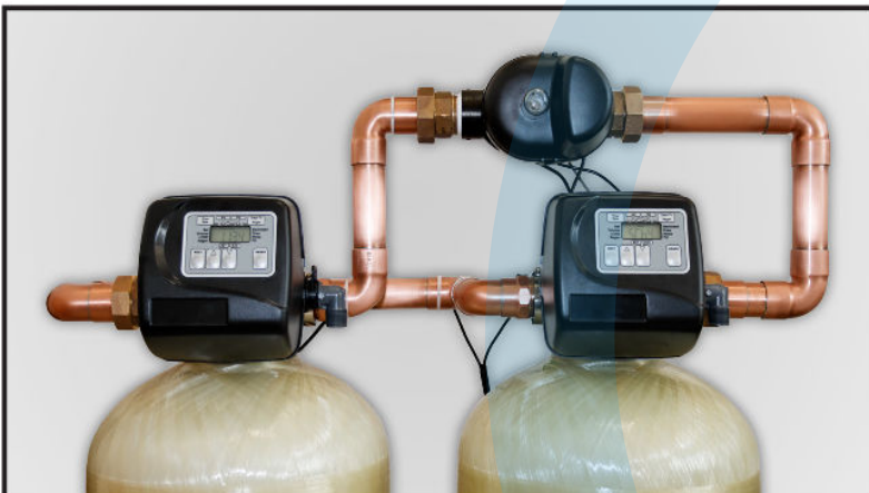
EXAMPLE OF A TWIN CONFIGURATION