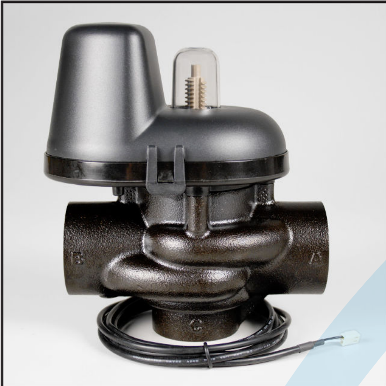
Order No. V3071 • NPT Order No. V3071BSPT • BSPT