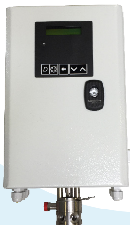
Coffret électrique NXT