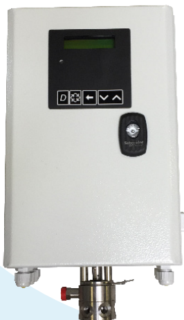
Coffret électrique NXT