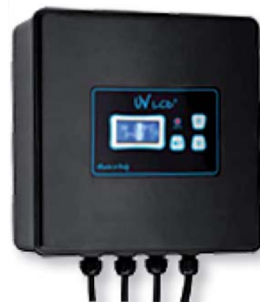
LCD 2 (PLUS)