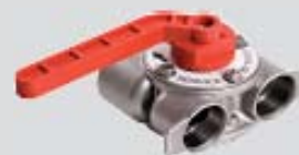
Bypass inox 1"